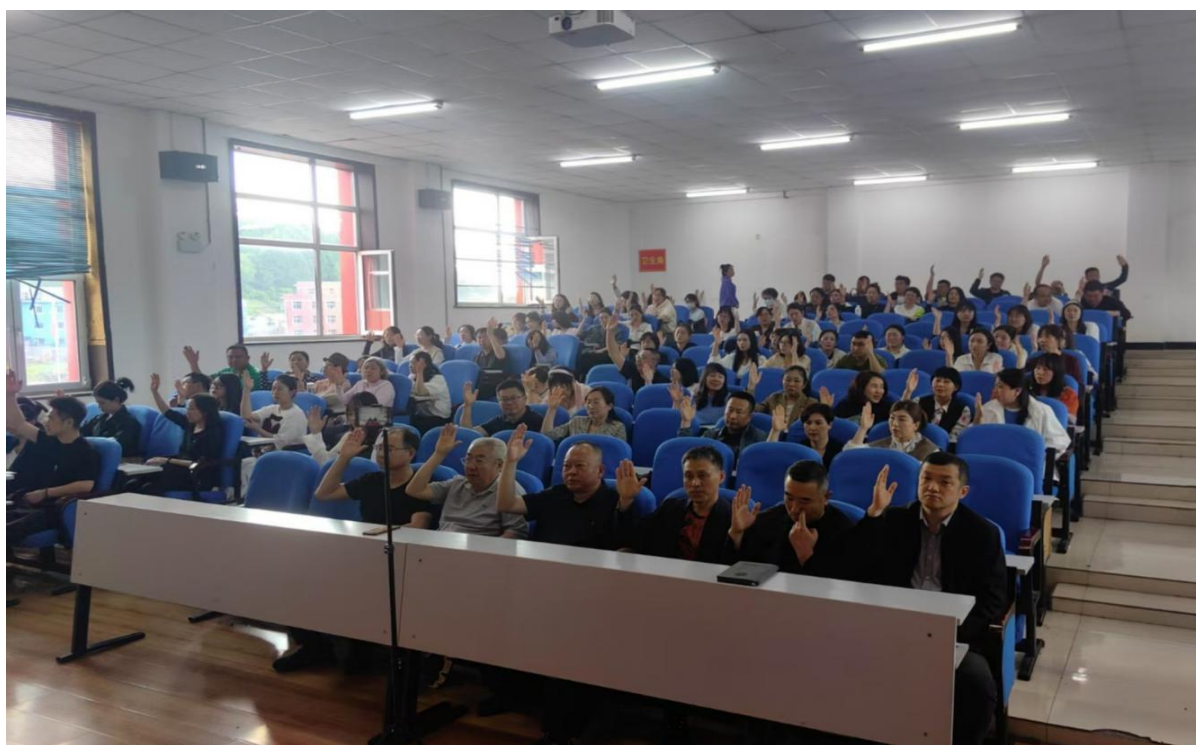
图 7-2 2025 年 11 月 17 日职工大会职工举手表决