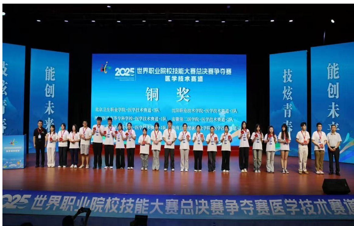
图3-2职业技能大赛国赛颁奖现场