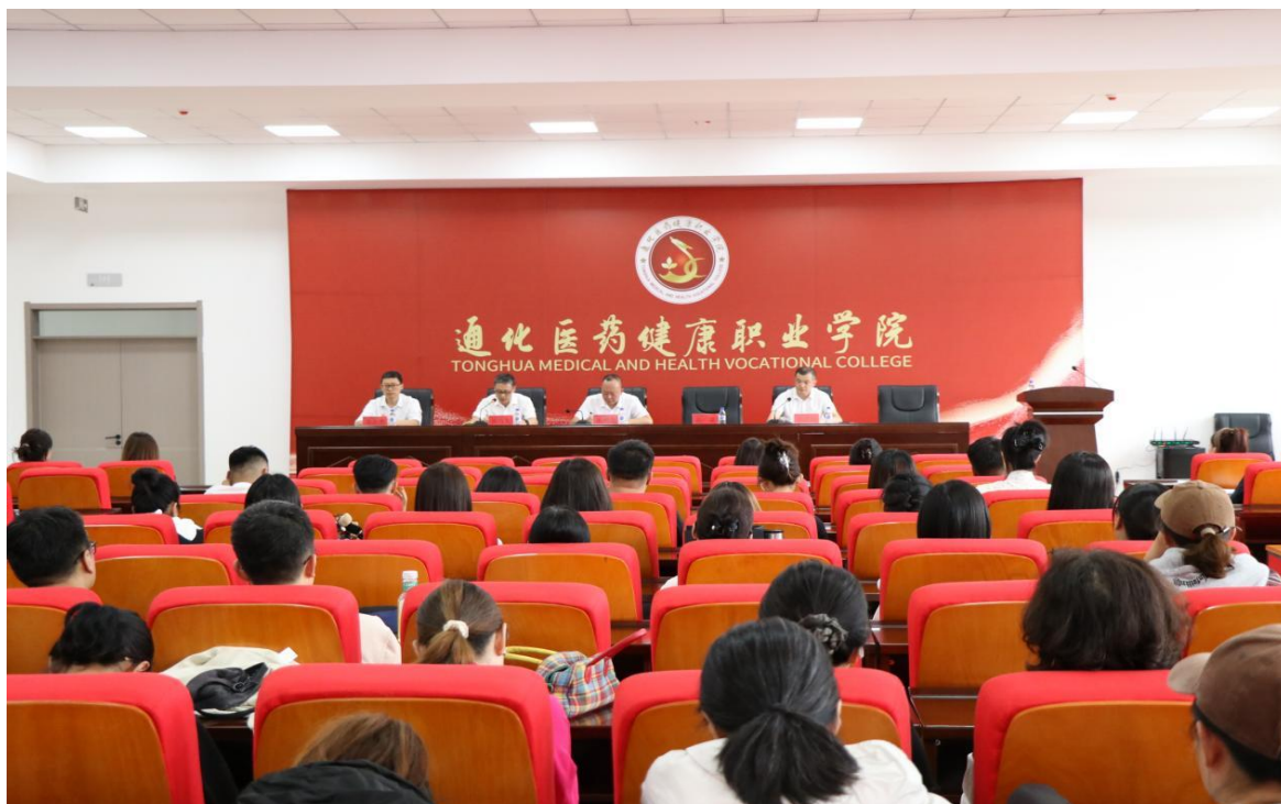
图 2-5 突出问题系统整治工作推进大会