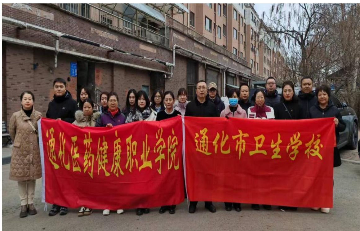
图 4-4 组织党员开展“学习雷锋见行动 环境整治树新风”志愿服务活动