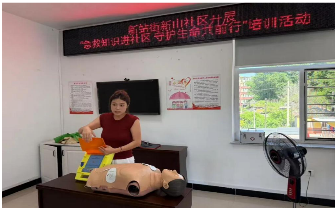
图 4-7 “急救知识进社区 守护生命共前行”培训

发挥党建品牌效用。组织基层党支部到社区、小学、万达商场等地开展医药健康知识普及活动。与管辖新山社区进行共建，打造“医养知识进社区”党建品牌活动，为社区居民和工作人员送去健康讲座、应急救护培训、家庭穴位保健按摩等康养知识；与靖宇小学联合开展“薪火传承，中医药文化进校园”活动，开展了“弘扬中医 薪火岐黄——靖宇小学中医药文化节”活动；参与团市委在万达购物广场组织的“脆皮青年 养生大会”中医药养生市集活动。坚持发挥自身特长，用专业知识守护人民健康，以实际行动践行党的初心和使命。