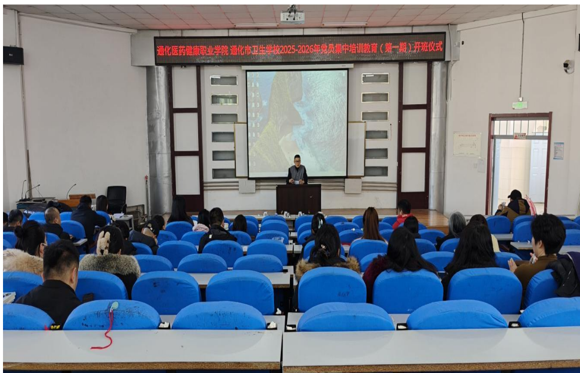
图 2-2 党员培训—重温入党誓词