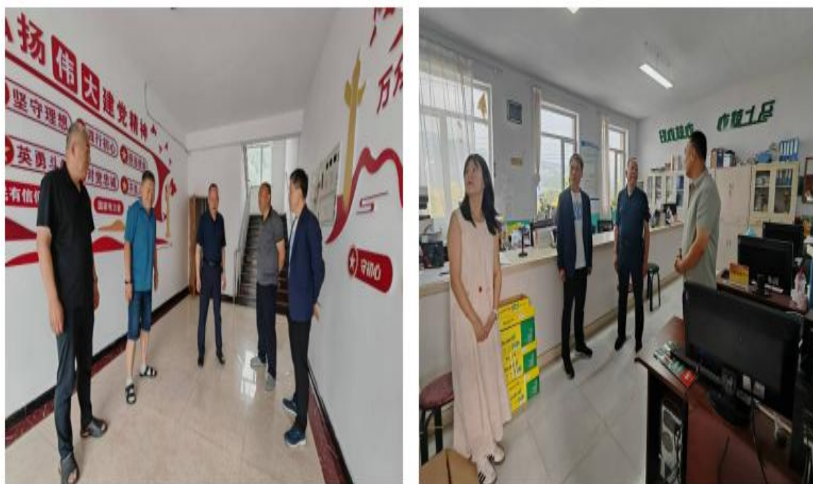
图 4 -3 学院领导走访慰问驻村干部

为持续巩固拓展脱贫攻坚成果与乡村振兴有效衔接，开创乡村振兴新局面，选派综合素质高、业务能力强的优秀干部开展驻村帮扶工作。学院派出 2 名同志到集安市太王镇上解放村和通胜街道通沟村担任乡村振兴驻村工作队员，做好脱贫攻坚与乡村振兴衔接工作，在完成驻村工作队与村两委工作的同时，开拓思路积极主动的为乡村谋发展、想计策、寻出路。