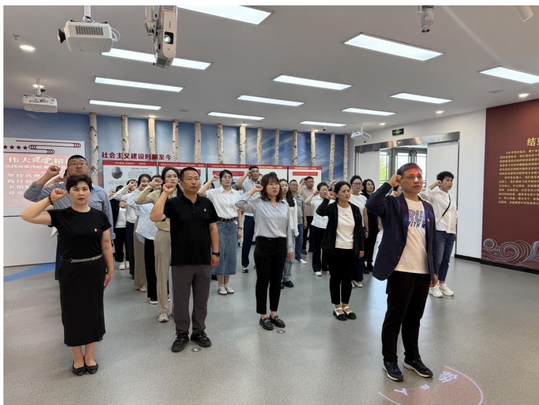
图 2-3 参观廉政警示教育展馆重温入党誓词