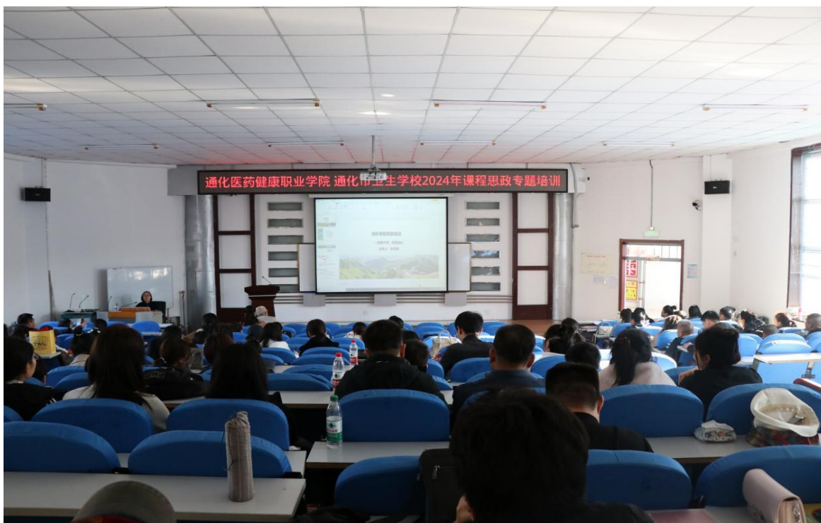
图 3-1 课程思政专题培训