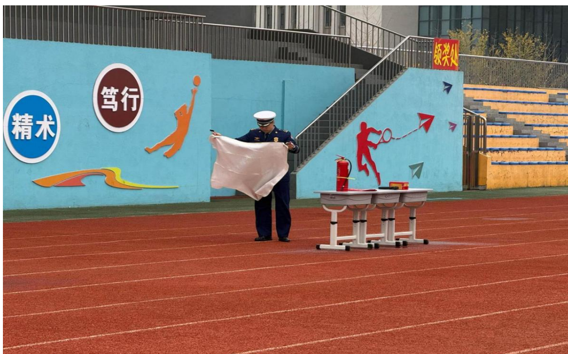
图2-7同学们参与模拟油盆灭火演练